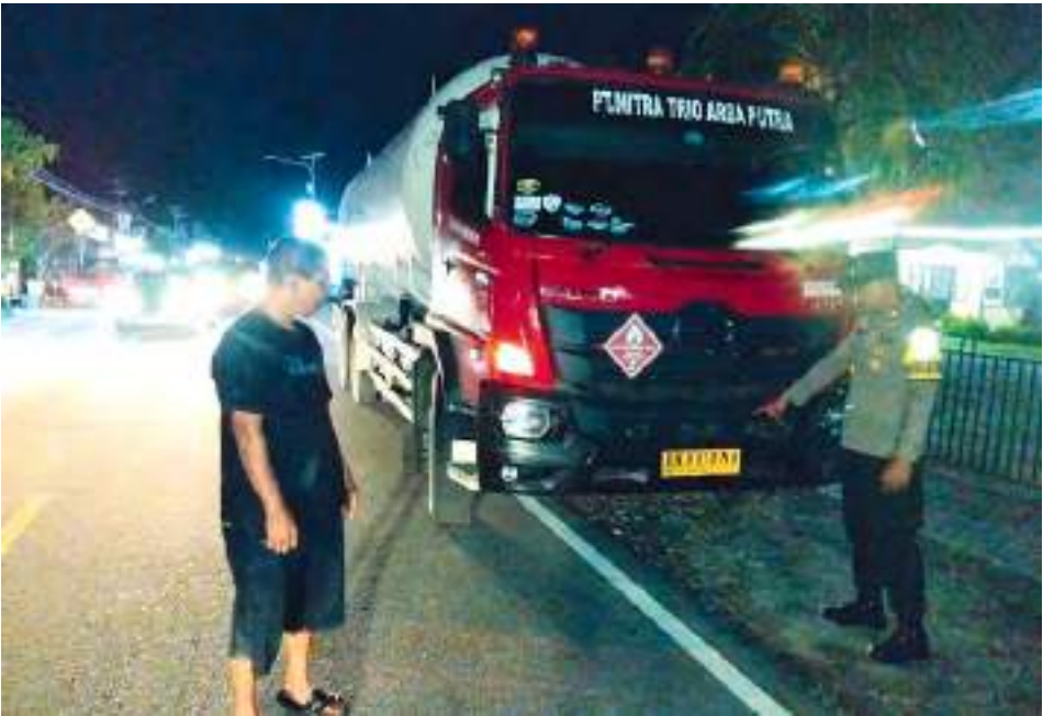
PETUGAS Polsek Torue saat berada di lokasi Kecelakaan lalu lintas di Jalan Trans Sulawesi, Desa Torue, Kecamatan Torue, Kabupaten Parigi Moutong (Parmout), Ahad (24/5/2026) malam.