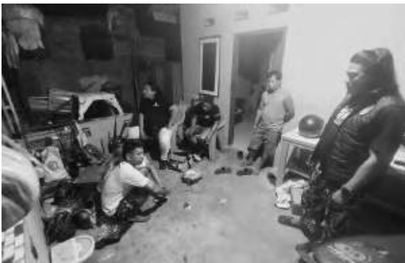
TIM URC Polres Donggala, saat mengamankan pelaku pencurian bersama beberapa barang bukti, belum lama ini.

Dari hasil interrogasi, pelaku mengakui telah melakukan beberapa aksi pencurian di rumah korban. Barang-barang yang berhasil dicuri antara lain satu unit trafo las, satu