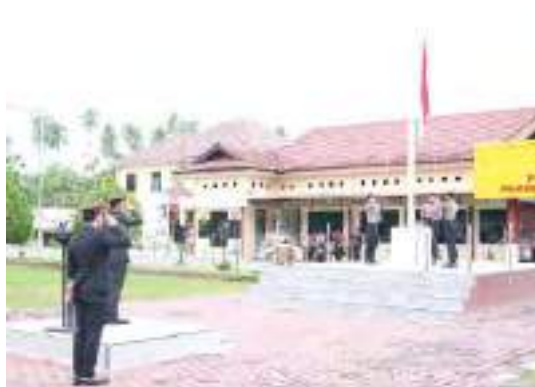
UPACARA peringatan Hari Lahir Pancasila di halaman Mapolres Parigi Moutong, Senin (1/6/2026).