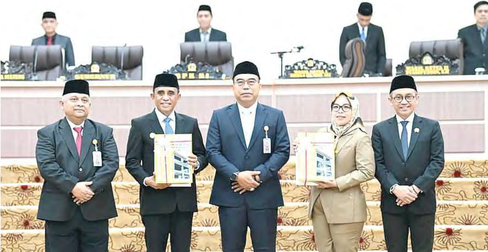
RAPAT PARIPURNA penyerahan LHP BPK RI yang digelar di Ruang Sidang Utama DPRD Sulteng, Selasa (2/6/2026).