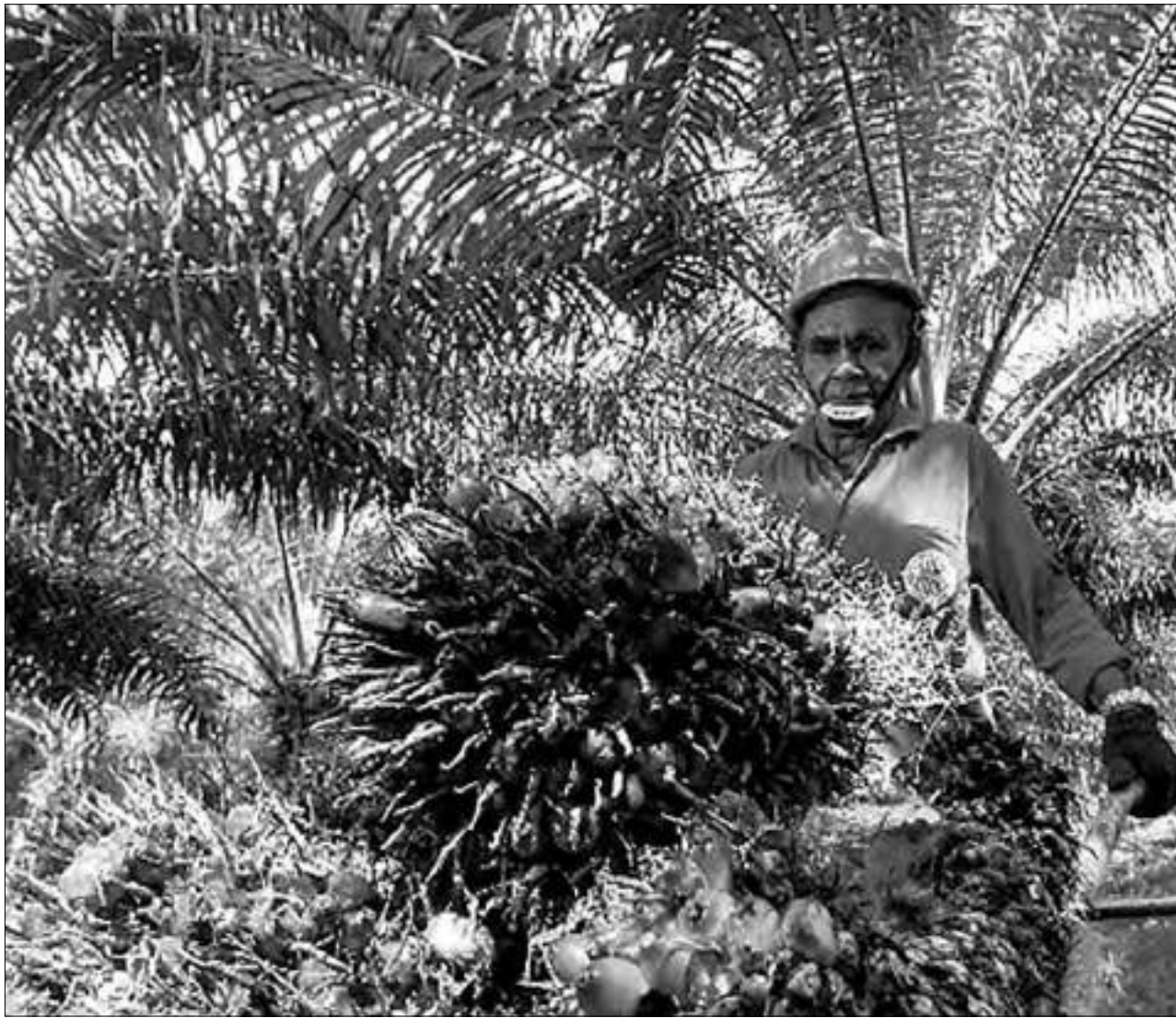
PEKERJA mengangkut hasil panen kelapa sawit.

SULTENG RAYA - Danantara Indonesia memastikan kehadiran Danantara Sumber Daya Indonesia (DSI) tidak akan mengganggu mekanisme perdagangan global komoditas strategis seperti sawit dan batu bara. Danantara menilai sistem perdagangan internasional yang sudah terbentuk tetap menjadi acuan utama dalam penentuan harga dan transaksi ekspor komoditas.