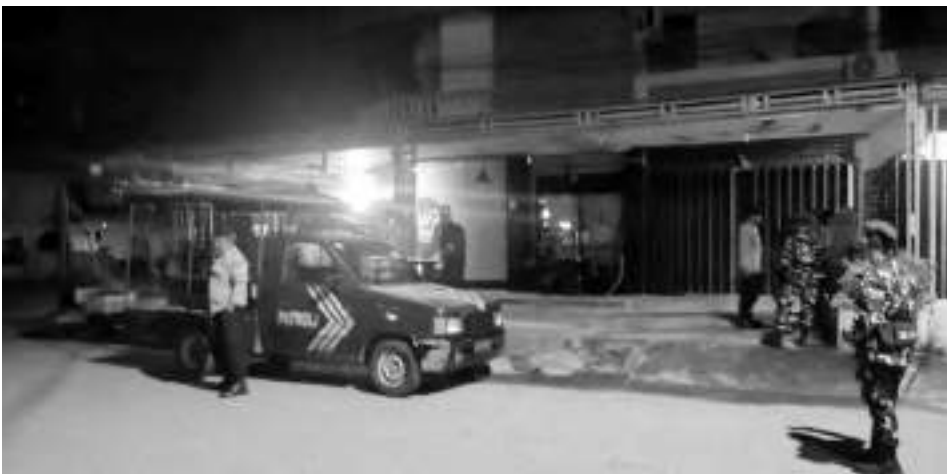
PERSONEL TNI-Polri, saat melaksanakan patroli gabungan dini hari, Minggu (31/5/2026).

“Selama pelaksanaan patroli berlangsung, situasi kamtibmas di wilayah hukum Polsek Baolan terpan-tau aman, tertib, dan kondusif tanpa adanya gangguan keamanan yang menonjol,” jelasnya. AMR