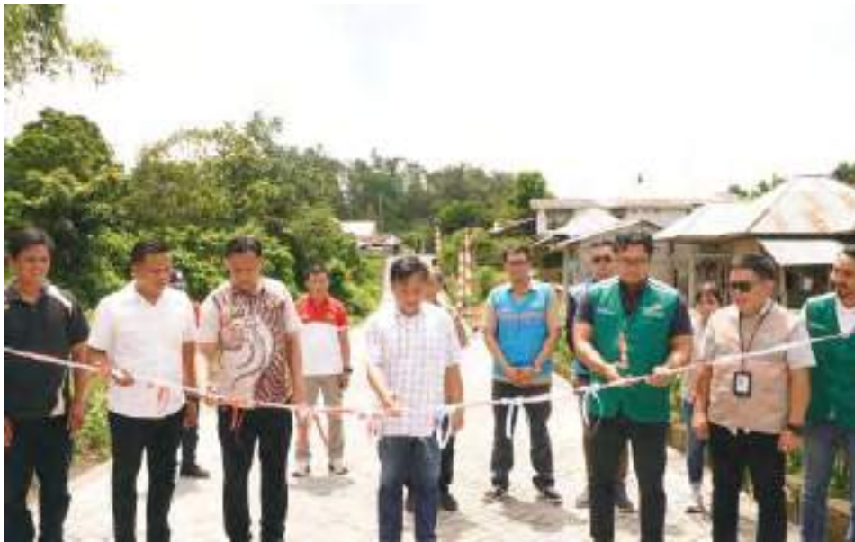
SEREMONI gunting pita sebagai tanda peresmian pembangunan jalan paving blok di ruas strategis tersebut pada Kamis (21/5).

SULTENG RAYA - Bagi warga Desa Tempang Dua di Kecamatan Langowan Utara, Kabupaten Minahasa, jalan bukan sekadar hamparan tanah atau tumpukan batu. Jalan adalah urat nadi kehidupan. Selama bertahun-tahun, ruas jalan Kasamaan-Sembel menjadi saksi bisu perjuangan sehari-hari warga yang melintas sambil membawa