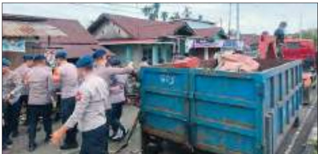
PERSONEL Batalyon C Pelopor Satbrimob Polda Sulteng langsung melanjutkan aksi kemanusiaan dengan menggelar giat bantuan SAR pembersihan sisa-sisa sampah dan material pascabanjir di Desa Bahoruru, Kecamatan Bungku Tengah, Kabupaten Morowali.

SULTENG RAYA - Setelah berhasil mengamankan barang-barang berharga milik masyarakat yang terdampak banjir, personel Batalyon C Pelopor Satbrimob Polda Sulteng langsung melanjutkan aksi kemanusiaan dengan menggelar giat bantuan SAR pembersihan sisa-sisa sampah dan material pascabanjir di Desa Bahoruru, Kecamatan Bungku Tengah, Kabupaten Morowali. Langkah cepat ini dilakukan seiring dengan mulai surutnya genangan air di beberapa titik pemukiman. Dengan menggunakan peralatan pendukung, para personel Brimob bersama warga setempat bahu-membahu membersihkan endapan lumpur, tumpukan sampah, serta ranting pohon yang menyumbat fasilitas umum dan jalur drainase.