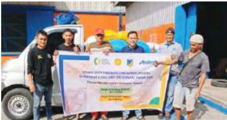
PERUM Bulog Kantor Wilayah Sulawesi Tengah menyalurkan sebanyak 2 ton jagung kepada peternak dalam program Stabilisasi Pasokan dan Harga Pangan (SPHP) jagung di tingkat konsumen atau peternak yang dilaksanakan pada Sabtu (30/5/2026).

Secara nasional target salur SPHP jagung sebanyak 213,1 ribu ton, lalu ketersediaan stok cadangan jagung pemerintah (CJP) per 13 Mei berada di angka 234 ribu ton. ANT