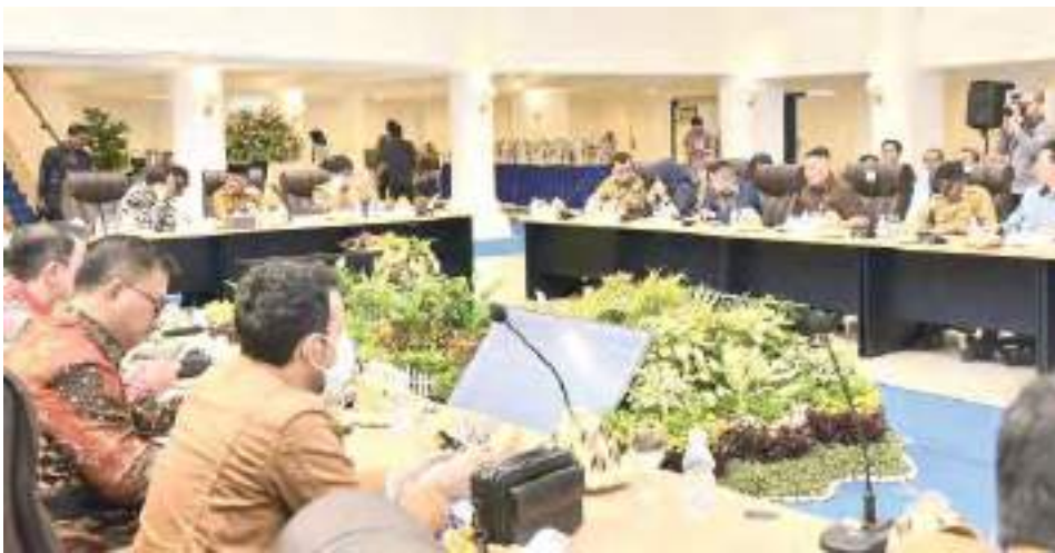
KOMISI IX DPR RI menyerap aspirasi dan masukan terkait penyusunan Rancangan Undang-Undang (RUU) Ketenagakerjaan di Kota Palu, Selasa (2/6/2026).

Kunjungan kerja spesifik tersebut bertujuan meng-