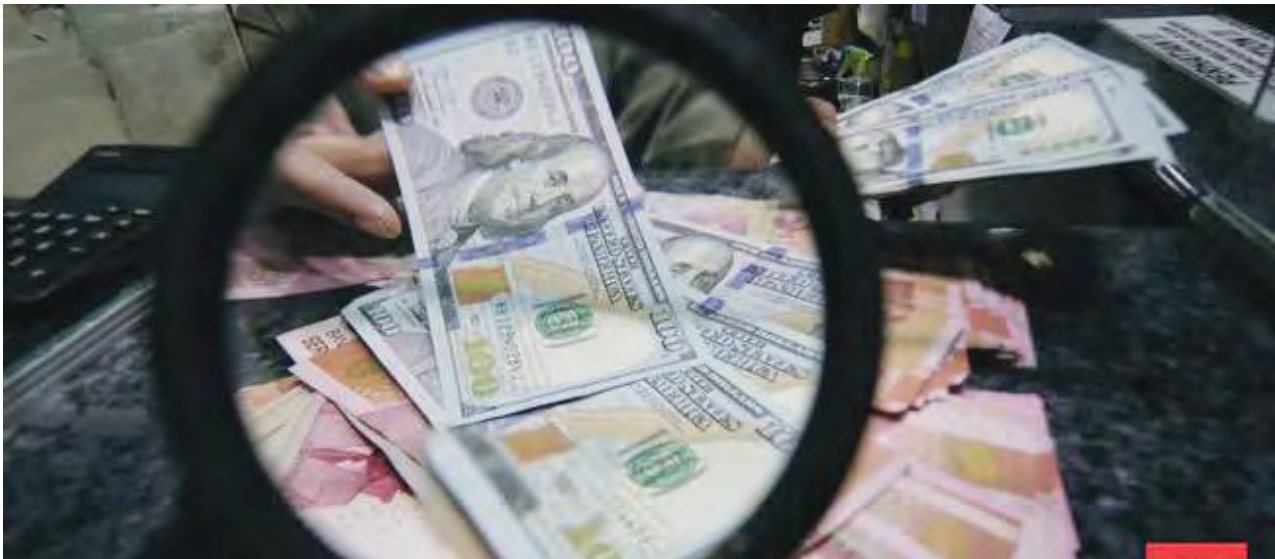
NILAI tukar rupiah ditutup melemah 0,19 persen ke Rp17.839 per dolar AS pada perdagangan Selasa (2/6) sore. Ilustrasi.