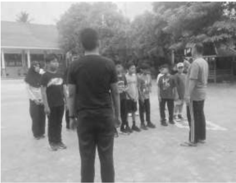
SEJUMLAH murid SDN Ratolindo, saat mengikuti latihan disiplin berlalu lintas, Sabtu (30/5/2026).

Melalui kegiatan tersebut, Satlantas Polres Touna terus berupaya menanamkan nilai-nilai disiplin, tanggung jawab, dan keselamatan berlalu lintas kepada generasi muda sebagai pelopor keselamatan di masa depan. AMR