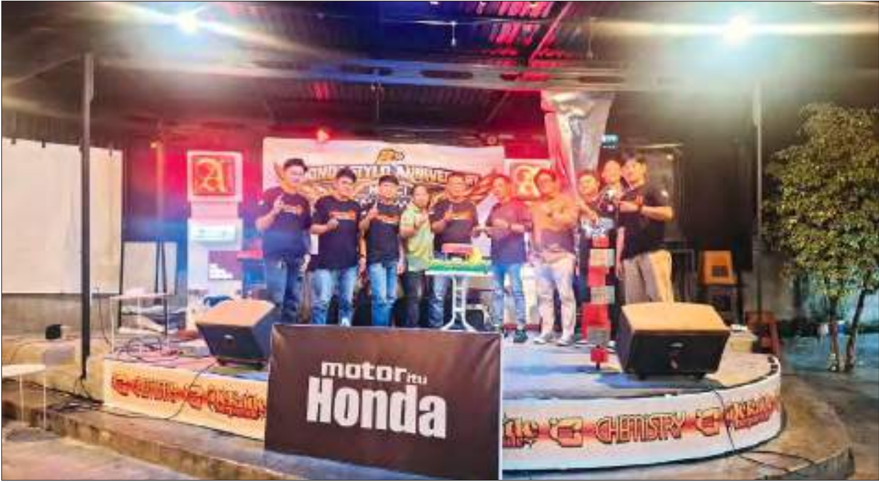
POSE bersama dalam pelaksanaan Declaration dan Anniversary Honda Stylo Club Indonesia (HASCI) Luwuk Chapter yang berlangsung di Kabupaten Banggai.

SULTENG RAYA – Semangat kebersamaan dan persaudaraan mewarnai pelaksanaan Declaration dan Anniversary Honda Stylo Club Indonesia (HASCI) Luwuk Chapter yang berlangsung di Kabupaten Banggai.