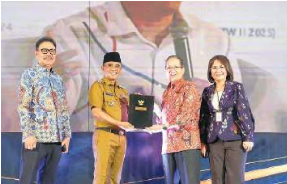
SUASANA pembukaan rakor Produk Hukum Daerah Regional Sulawesi Tahun 2026 di Swiss-Belhotel Silae Palu, Selasa (2/6/2026).

Kegiatan tersebut dihadiri Direktur Produk Hukum