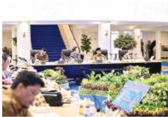
GUBERNUR SULTENG Anwar Hafid mengikuti kunjungan kerja spesifik Komisi IX DPR RI dalam rangka penyerapan masukan terhadap RUU Ketenagakerjaan.

SULTENG RAYA - Gubernur Sulawesi Tengah Anwar Hafid mendorong revisi Rancangan Undang-Undang (RUU) Ketenagakerjaan memberikan keberpihakan lebih kuat kepada tenaga kerja lokal agar menjadi pelaku utama dalam pembangunan industri di daerah.