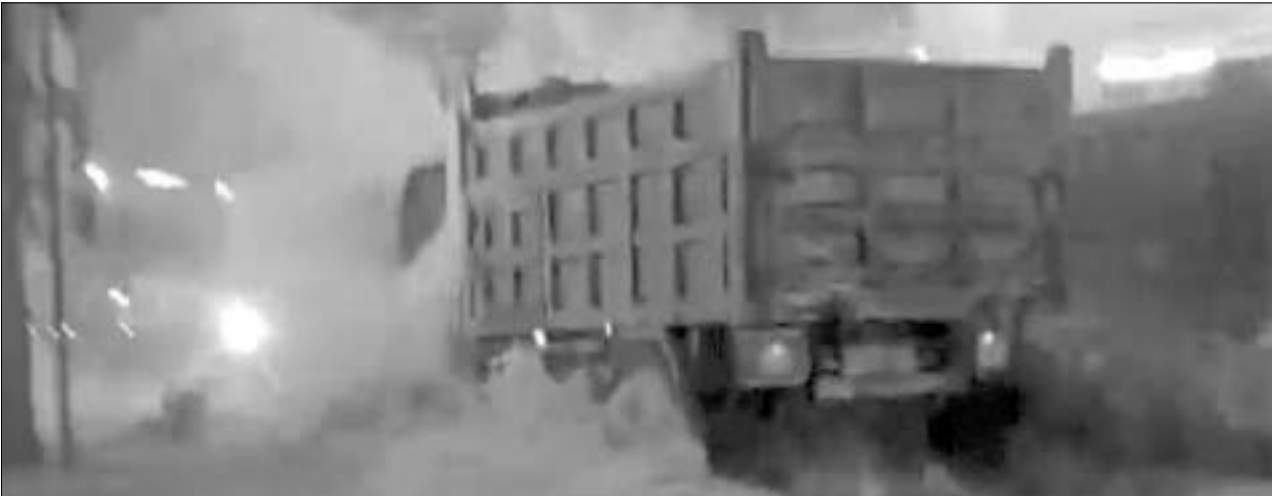
BANJIR rendam sejumlah wilayah di Cepu.

SULTENG RAYA - Banjir melanda Kecamatan Cepu, Kabupaten Blora, Jawa Tengah, Minggu malam, merendam puluhan rumah akibat luapan sungai setelah hujan deras mengguyur wilayah tersebut.