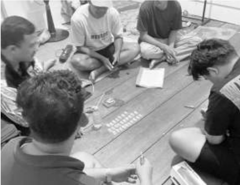
SEJUMLAH barang bukti sabu yang disita Polisi dari pengungkapan kasus narkotika di wilayah Luwuk Selatan, Selasa (2/6/2026).

Saat ini, penyidik Sat Narkoba Polres Banggai masih terus melakukan pendalaman guna mengungkap kemungkinan adanya jaringan lain yang terkait dengan pelaku. AMR