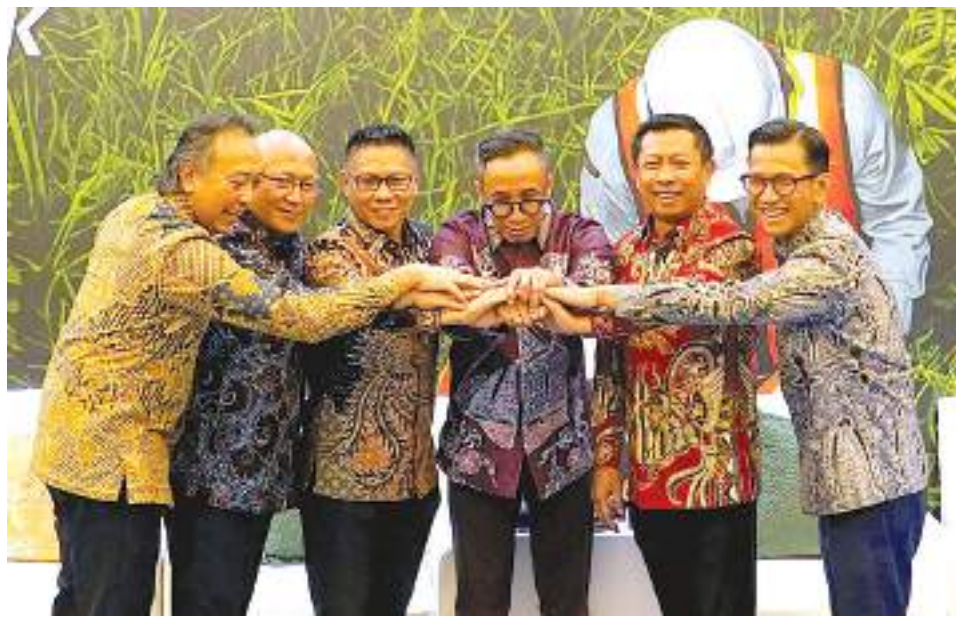
GAJARAN direksi PT Vale.