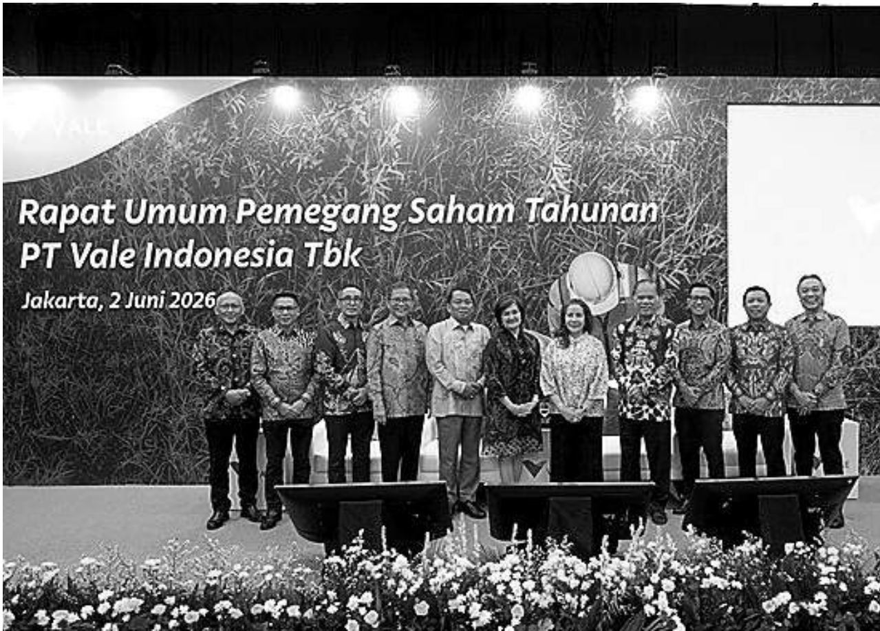
RUPST PT Vale di Jakarta, Selasa (2/6/2026).

“Selama ini perusahaan daerah di Sulteng belum tertarik berinvestasi bidang perkebunan durian. Padahal bidang usaha ini sangat menjanjikan dari aspek bisnis, karena durian telah menjadi komoditas ekspor, sekaligus telah menjadi komoditas unggulan nasional,” ujarnya. Hengky mengatakan membuka lahan perkebunan durian 100 ribu hektare tidak terlalu berat, apabila program tersebut menjadi agenda bersama dengan