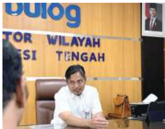
PIMWIL Bulog Kanwil Sulteng, Jusri.

Rekor Baru Penguatan Cadangan Pangan Nasional