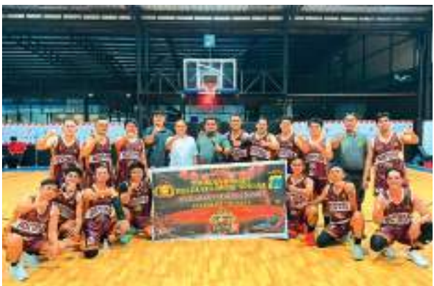
TIM bola basket Polda Sulawesi Tengah.