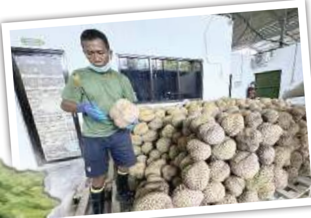
SEORANG pekerja sedang menyortir buah durian di salah satu rumah kemas durian di Kabupaten Parigi Moutong, Kamis (28/5/2026).

SULTENG RAYA - Asosiasi Perkebunan Durian Indonesia (Apdurin) mengatakan Sulawesi Tengah (Sulteng) perlu menyiapkan lahan minimal 100 ribu hektare kalau bercita-cita ingin menjadi raja durian dunia.