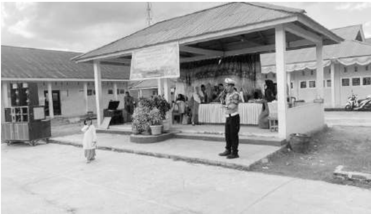
PERSONEL Satlantas Polres Buol, saat memberikan imbauan mengenai ketertiban saat berkendara kepada pelajar SMPN 2 Biau, Selasa (2/6/2026).

Melalui peringatan tersebut, seluruh komponen masyarakat diajak untuk memperkuat persatuan, menjaga kerukunan, serta bersama-sama membangun Indonesia yang maju, adil, dan sejahtera. Sebab, di tengah keberagaman yang menjadi kekayaan bangsa, Pancasila tetap menjadi rumah besar yang menyatukan seluruh anak bangsa dalam satu tujuan, yakni Indonesia yang damai dan bermartabat. AMR