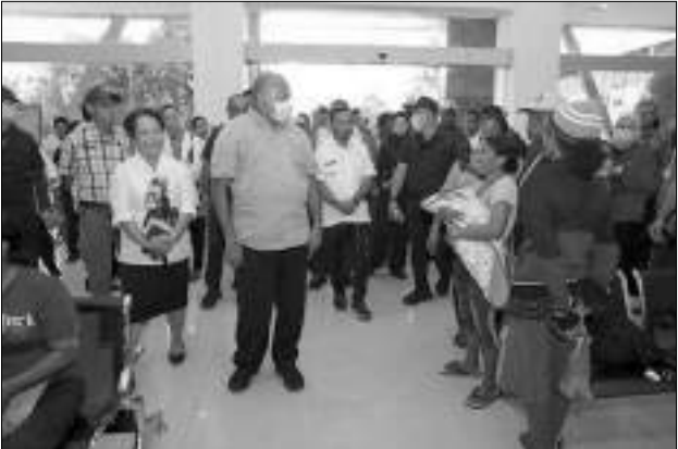
GUBERNUR Papua siapkan RSUD Biak jadi RS rujukan di wilayah Saireri.

SULTENG RAYA - Gubernur Papua Matius D. Fakhri mempersiapkan RSUD Biak Numfor sebagai rumah sakit rujukan utama di wilayah Saireri untuk memperkuat pelayanan kesehatan bagi masyarakat di berbagai kabupaten sekitarnya.