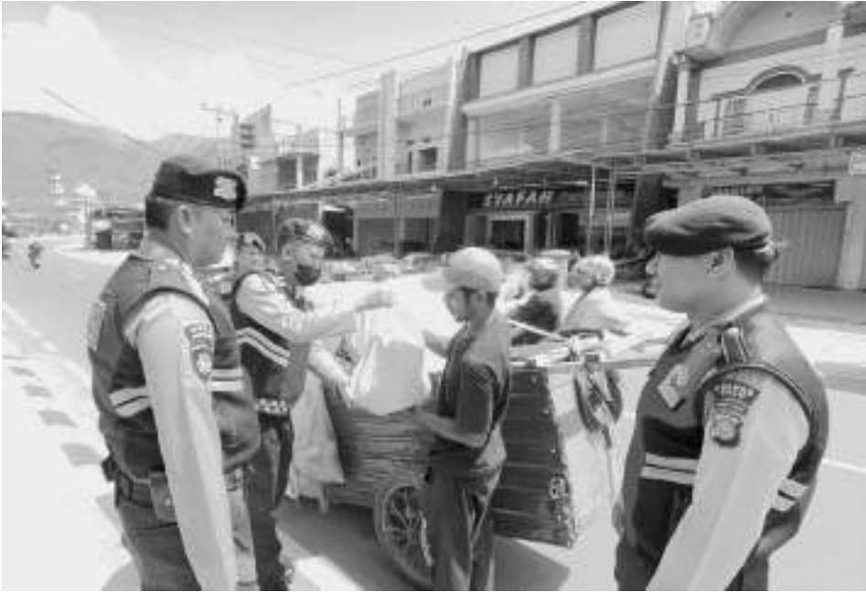
PERSONEL Sat Samapta Polresta Palu, saat membagikan sembako kepada warga di kawasan Pasar Inpres Manonda, Rabu (3/6/2026).

Melalui kegiatan ini, Polresta Palu berharap dapat terus merajut kedekatan dan kepercayaan masyarakat, serta menginspirasi pihak lain untuk saling berbagi demi terwujudnya Kota Palu yang aman, kondusif, dan penuh rasa kepedulian. AMR