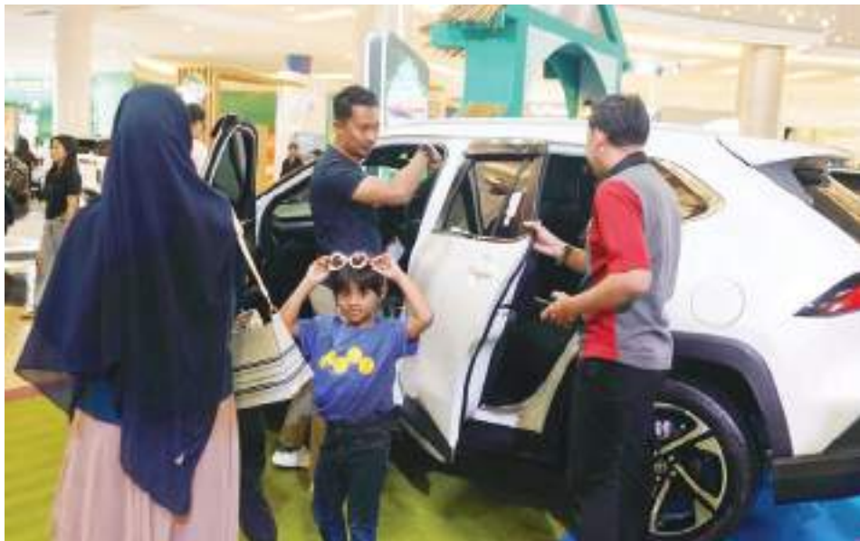
MARKETING Kalla Toyota melayani calon customer pada iven display Kalla Toyota di salah satu pusat perbelanjaan.

SULTENG RAYA - Tingginya nilai jual kembali (trade in) kendaraan Toyota di pasar otomotif Sulawesi bahkan Indonesia tak lepas dari kombinasi berkelanjutan yang dimiliki dealernya - Kalla Toyota. Kualitas produk yang teruji, jaringan layanan purna jual yang luas, serta kemudahan mendapatkan suku cadang dinilai menjadi tiga faktor kunci agar konsumen makin mantap untuk me-