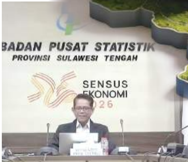
KEPALA BPS Sulawesi Tengah Daryanto.