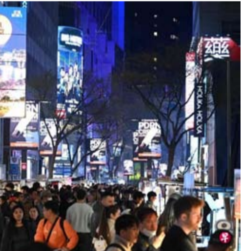
韩国更改电子入境卡内容，删除出现“中国（台湾）”选项的栏目。图为韩国首尔明洞，摄于4月1日。(法新社)

有记者提问：今天下午，韩国外交部发言人表示，韩国政府通过1992年韩中建交联合声明及期间韩中共同声明，持续确认了尊重只有一个中国、台湾是中国的一部分的立场，强调尊重这样一个中国的立场没有改变。此次电子入境书相关措施只是为了增进访问国便利，简化出入境管理系统，统一纸质电子入境书格式的行政和技术措施。此前，据韩媒报道，韩国外交部官员称，韩方决定删除电子入境申报系统中的“前出发地”和“下一目的地”选项，旨在简化出入境手续、统一电