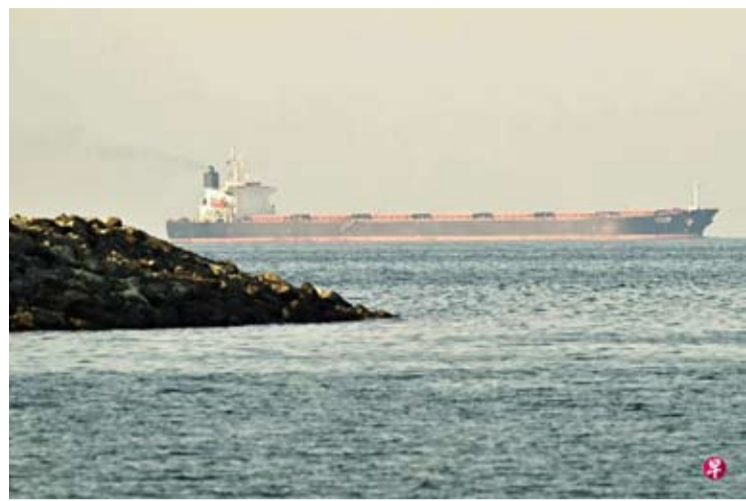
图为2月25日，一艘货船在阿联酋北部岸外的霍尔木兹海峡海域航行。

朗整个海岸线及其能源基础设施。通告指出，无论悬挂何种旗帜，只要涉及伊朗港口或相关设施的船只，其通行均可能受到限制。尽管经霍尔木兹海峡往返非伊朗目的地的过境航行暂未完全阻断，但船只在通行过程中可能面临军事存在、通信指令及登临检查等情况。分析人士指出，此举被视为美国在美伊紧张关系背景下的进一步施压措施，或将推高地区军事对峙风险，并对全球能源运输通道产生持续影响。霍尔木兹海峡通行受阻，多艘船只绕行或中途