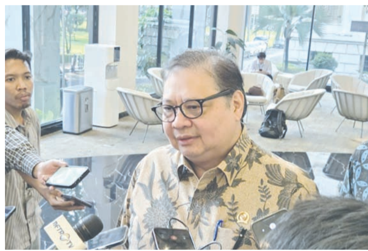
印尼经济统筹部长艾尔朗加·哈尔塔托(Airlangga Hartarto)(资料图片)。

印尼经济统筹部长艾尔朗加·哈尔塔托(Airlangga Hartarto)4月13日表示，美方此次调查主要聚焦两方面问题：一是在是否存在导致或维持制造业“结构