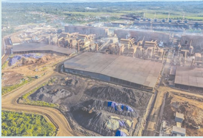
图为印尼东南苏拉威西省科纳韦县莫罗西地区VDNI冶炼厂园区航拍画面(资料图片)。

【本报讯】印尼能源与矿产资源部近日发布新规，对镍矿石和铝土矿基准价格(HPM)进行调整，新规将于2026年4月15日起正式实施。此次调整依据《2026年第144号能源与矿产资源部长令》，系对2025年第268.K/MB.01/MEM.B/2025号部长令的修订，主要涉及金属矿产品及煤炭销售基准价格制定机制的完善。