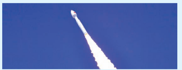
4月14日, 力箭一号遥十二运载火箭在东风商业航天创新试验区成功发射。

均属于高分辨光学遥感卫星, 具备超高分辨率、高集成度和智能化三大核心特点, 可采集高分辨率的高清全色影像, 支持同轨立体成像与敏捷成像, 谱段涵盖全色、蓝色、绿色、红色、近红外五个维度。(记者 马帅莎)