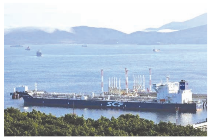
图为俄罗斯纳霍德卡港科兹米诺原油码头油轮“弗拉基米尔·阿尔谢尼耶夫”号(Vladimir Arsenyev)停靠作业场景(资料图片)。

部长巴赫利尔·拉哈达利亚(Bahlil Lahadalia)表示，印尼总统普拉博沃·苏比安托与俄罗斯总统弗拉基米尔·普京已就能源合作进行沟通，相关合作以务实推进和国家利益为导向。