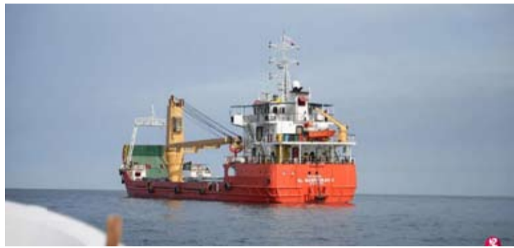
图为4月12日，霍尔木兹海峡靠近阿曼水域上的一艘船舶。

【中新网4月14日电】针对美国对所有进出伊朗港口船只实施封锁，美国方面13日援引军事专家的分析观点称，美方相关举措执行风险高，操作落实方面存在非常大的难度。首先，美国方面援引多名分析人士的话称，美军并不存在海上优势，伊朗仍具备海上反击能力，可能使用水雷、武装导弹快艇、水面无人艇、无人机、陆基巡航导弹等武器对执行封锁的美军发起反击。有军事专家指出，鉴于伊朗有这些反击选项，封锁行动“风险很高”。