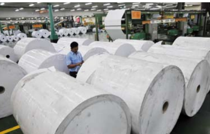
一家造纸厂的生产活动中。

【本报讯】在全球不确定性的背景下, 国内纸浆与造纸工业的前景仍显示积极方向。 然而, 业界人士被要求警惕生产成本压力、供应链中断以及日益激烈的进口产品竞争。 印尼工商会(Kadin)工业部副主席萨利赫·胡辛(Saleh Husin)称, 纸浆与造纸行业仍是国家制造业的战略支柱之一, 对加工工业的国内生产总值贡献约3.7%。此外, 强劲的出口表现和支持性的全球趋势是该行业前景的主