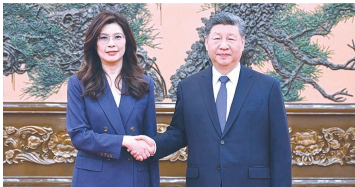
4月10日上午，中共中央总书记习近平在北京会见郑丽文主席率领的中国国民党访问团。

2026年4月10日，北京春意盎然。中共中央总书记习近平在北京会见了中国国民党主席郑丽文率领的访问团。这是国共两党领导人时隔十年后的再次正式会面，具有承前启后、继往开来的重要意义。习近平在会见中指出：“两岸同胞都期盼台海和平安宁，期盼两岸关系改善发展，期盼生活更