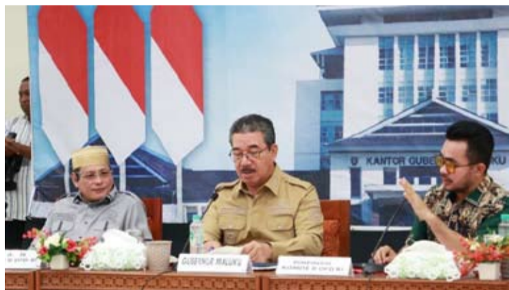
地方代表理事会 (DPD) 与马鲁古省政府于周二 (4月14日) 在安汶市举行会议, 讨论关于监督马塞拉区块 (Blok Masela) 国家战略项目的开发。

【本报讯】印尼地方代表理事会 (DPD) 通过第二委员会对马鲁古省进行工作访问, 以监督马塞拉区块 (Blok Masela) 国家战略项目和2007年第30号能源法的实施情况。