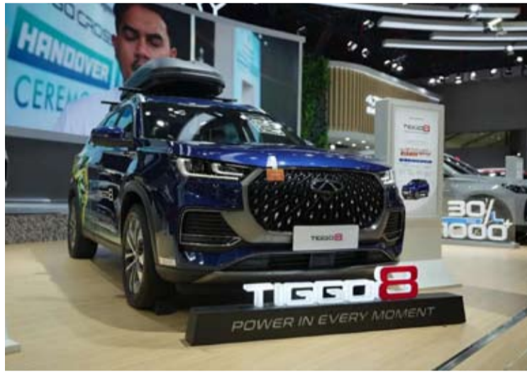
奇瑞瑞虎8 (Chery TIGGO 8)。

【本报讯】2026年3月, 奇瑞集团(Chery Group)在全球销量创下历史新高, 达到240,678辆, 比去年同期增长12.1%。 至今, 奇瑞全球用户累计已达1912万, 其中国际市场用户超过623万。该事宜已巩固了奇瑞作为中国领先汽车出口商的地位。 根据日前收到的新闻稿, 奇瑞公司全球销量增长得益于销量提升、出口市场拓展, 以及成功打入监管标准较高的市场。 管理层在一份声明中表示, “该发展表明, 我们正在进行的全球转型已进入更加成熟的阶段, 从单纯的规模扩张迈向更高质量和可持续的增长。” 继2月份为首个出口