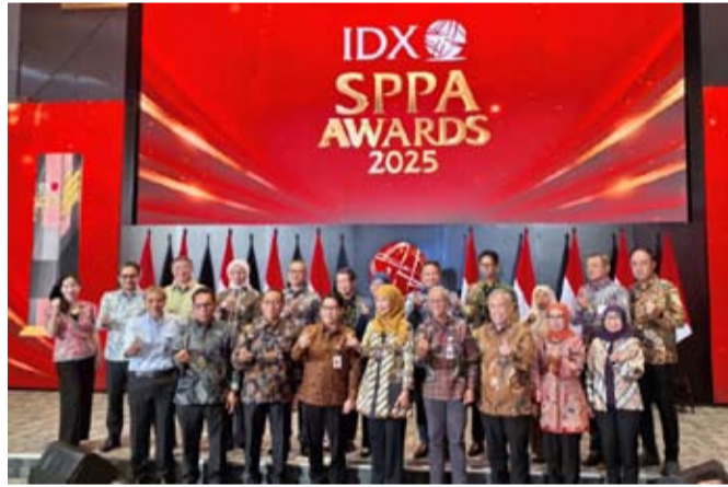
图为：在金融服务管理局（OJK）的支持下，印尼证券交易所（IDX）于4月13日（周一）在雅加达IDX主大厅举行2025年另类市场组织系统（SPPA）颁奖典礼。

【本报讯】印尼证券交易所（IDX）公布，另类市场组织系统（SPPA）2025年全年总交易额达1382.1万亿盾，同比增长461.6%。