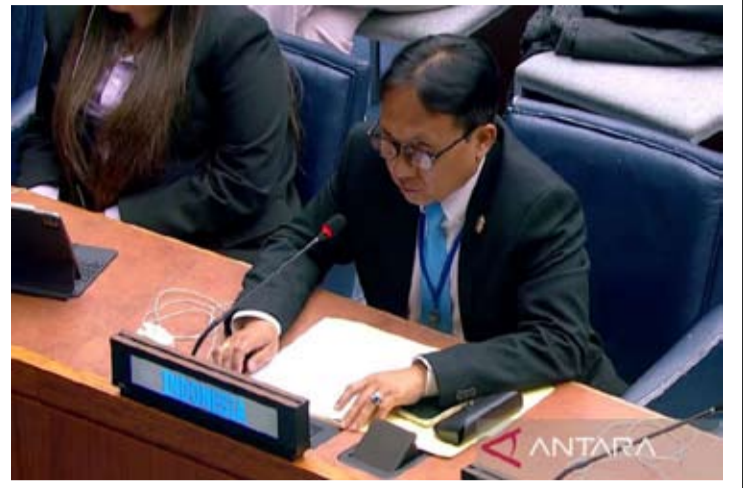
印尼人口与家庭发展部人口控制副主任博尼瓦修斯 (Bonivasius Prasetya Ichtianto) 于4月13日至17日在美国纽约举行的联合国人口与发展委员会第五十九届会议上发表讲话。

博尼瓦修斯解释说, “运用数字技术旨在扩大教育和医疗服务的覆盖范围, 尤其惠及偏远和欠发达地区的社区。重点举措包括‘智慧印尼’数字化学习转型计划、提升公众数字素养, 以及为人工智能、自动化和工业4.0时代培养劳动力。”