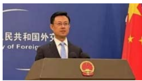
中国外交部发言人郭嘉昆

【中新网北京4月14日电】中国外交部发言人郭嘉昆14日主持例行记者会。有记者提问：近日有媒体报道称，中国向伊朗提供军事支持，美国总统特朗普表示，如果美国发现中国向伊朗提供武器，美国将对华加征50%的关税，请问中方对此有何评论？