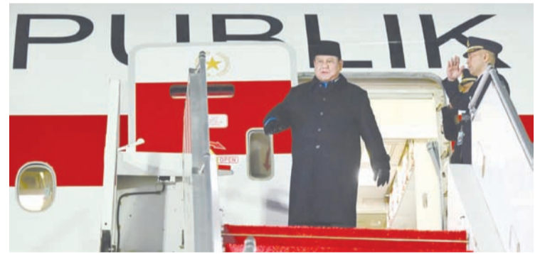
我国总统普拉博沃·苏比安托于当地时间2026年4月13日(星期一)晚上23点50分抵达法国巴黎。