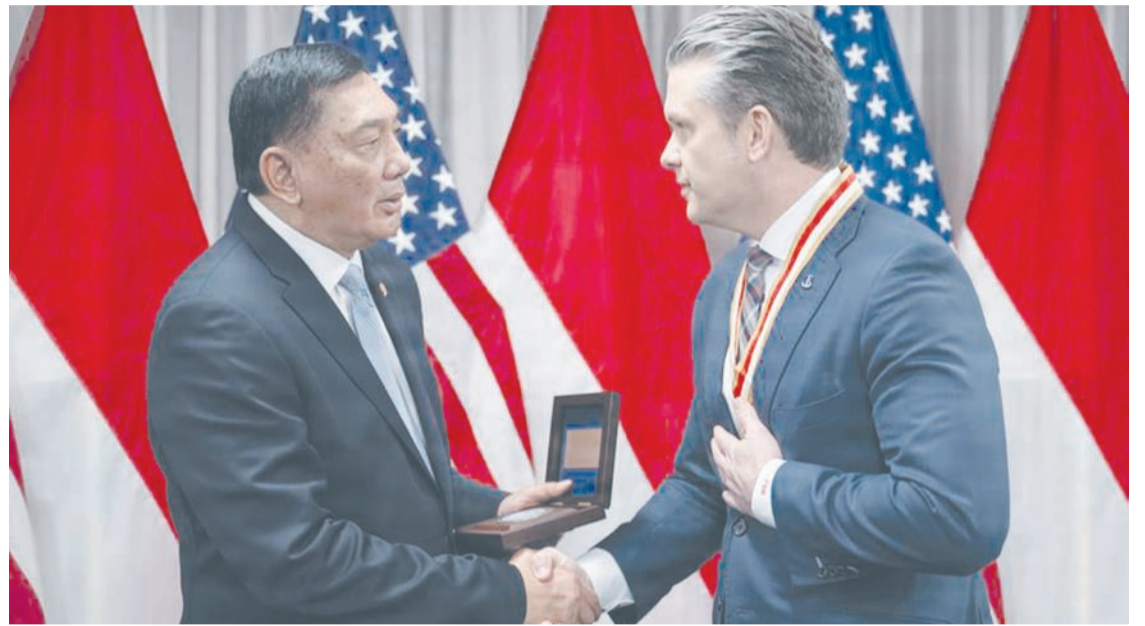
2026年4月13日，印尼国防部长夏弗里·善苏丁(左)与美国战争部长皮特·赫格塞思在五角大楼会面。

该伙伴关系是美印尼双边防务关系持续发展的体现，建立在数十年合作的基础之上。两国相互确认