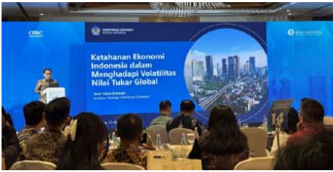
Noor Faisal Achmad

造业采购经理人指数（PMI）录得50.1，虽较2月的53.8有所回落，但仍处于扩张区间。