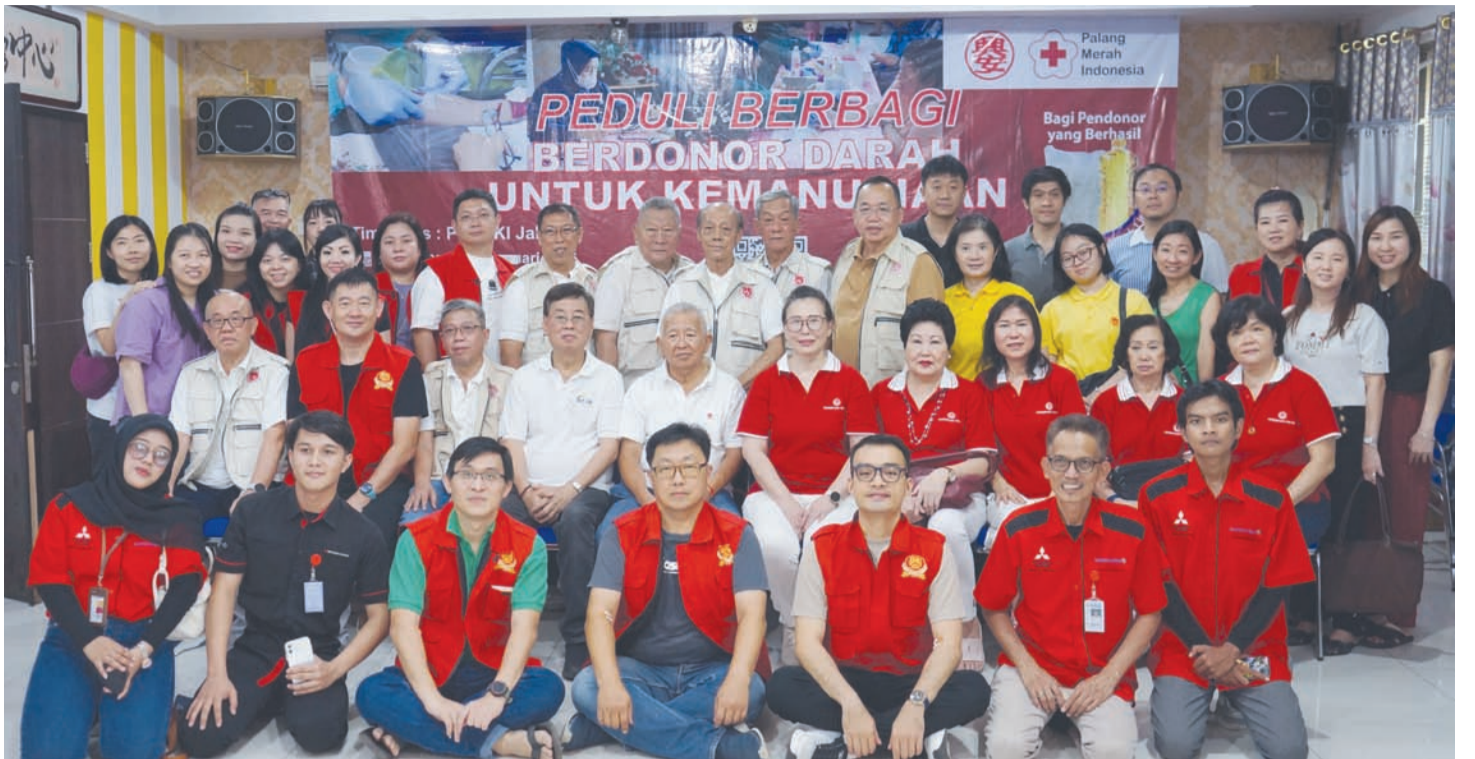
雅加达兴安会馆诸理事与志愿者合影留念。

此次捐血活动的圆满举办, 不仅彰显了兴安会馆的社会担当, 也进一步增强了公众对无偿献血重要性的认识, 取得了良好的社会反响。