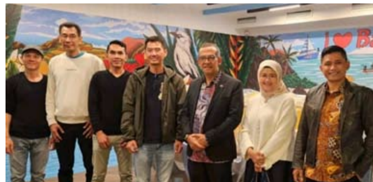
印尼大使阿里夫·巴萨拉玛于2025年9月23日访问位于埃里温的小巴厘餐厅。

餐厅由印尼侨民Fugen Chandra于2024年创立, 提供炒饭、马都拉鸡肉Soto