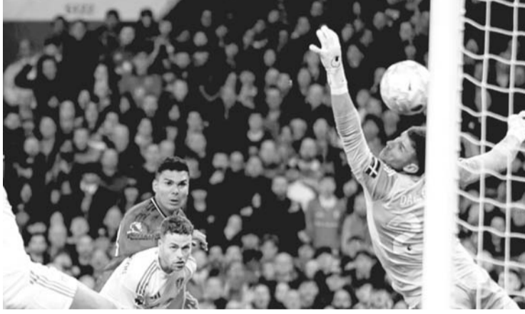
曼联vs利兹联。

【美都新闻网4月14日】雅加达时间4月14日凌晨, 英超第32轮, 曼联坐镇主场老特拉福德球场迎战利兹联。最终曼联1-2不敌利兹联。 积分榜方面, 曼联55分第