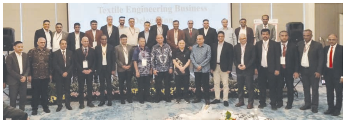
2026年4月13日，印尼纺织协会(API)与印度纺织工程协会在西瓜哇省万隆市举行会议。

印尼纺织协会还与印度纺织工程协会在万隆举办了互动商务会议，作为连接两国行业参与者的战略平台。该论坛有望开