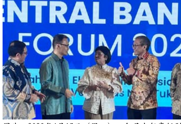
图为：2026年4月13日（周一），印尼央行高级副行长Destry Damayanti（左三）在雅加达出席2026年中央银行论坛。

续加强政策引导与市场稳定工作。金融领域对冲击反应最为直接，印尼央行将全力以赴维护宏观金融稳定。”